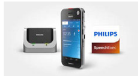
SpeechAir smartes Diktiergerät Workflow-Software SpeechExec Pro Dictate