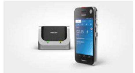
SpeechAir smartes Diktiergerät